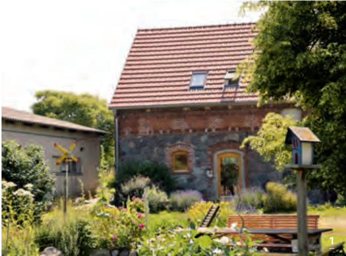
1 Zentraler Hofplatz von Hof Apfeltraum