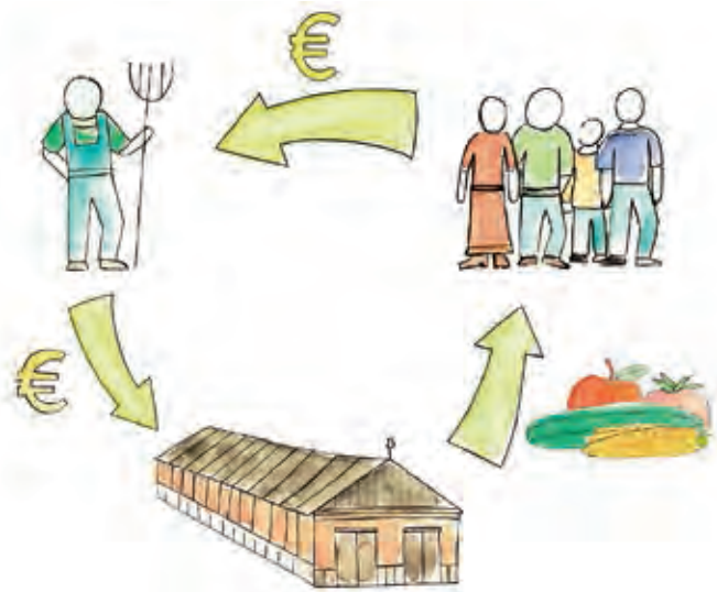
Funktionsweise Genussrecht mit Zins und Tilgung in Naturalien

Ein Modell für Menschen, die gerne kommunizieren Erzeuger, die den direkten und intensiven Kontakt mit Kunden nicht scheuen, können sich den Trend zu alternativen Beteiligungsformen zu Nutze machen und damit ihren Bestand sichern. Die Voraussetzungen dafür sind berufliches Engagement, ein vorurteilsfreier Umgang mit dem – oft städtischen – Verbraucher und die Bereitschaft, immer wieder Auskunft über Betriebsentscheidungen zu geben. Nur wer seiner Tätigkeit aus Überzeugung nachgeht, wird das auch langfristig leisten können und wollen. Die enge Beziehung zum Kunden kann sehr lohnend, aber auch sehr anstrengend sein. Wer nicht gerne mit Menschen spricht und sich von Besuchern auf dem Hof gestört fühlt, wird sich mit dieser Form der Finanzierung schwertun. In der medialen Kommunikation der großen Handelsketten funktioniert vielleicht eine Marketingstrategie ohne wirklichen Hintergrund. Für Genussrechte und andere Beteiligungsformen gilt das nicht: Sie können nur von Überzeugungstätern realisiert werden, denn ein direkter, intensiver und glaubwürdiger Kundenkontakt ist notwendig. ■