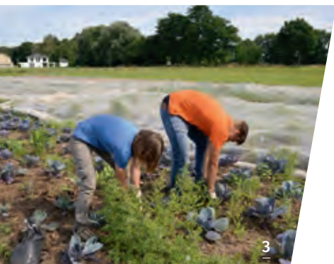
3 Unkraut jäten zwischen Rotkohl